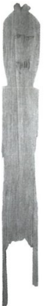
ケガレや罪の 身代わりに 俵田遺跡祭祀 遺構出土品 人形(山形県)