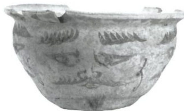
長岡京の災厄を祓う 長岡京東南境界祭祀遺跡出土品 人面墨書土器(京都市)