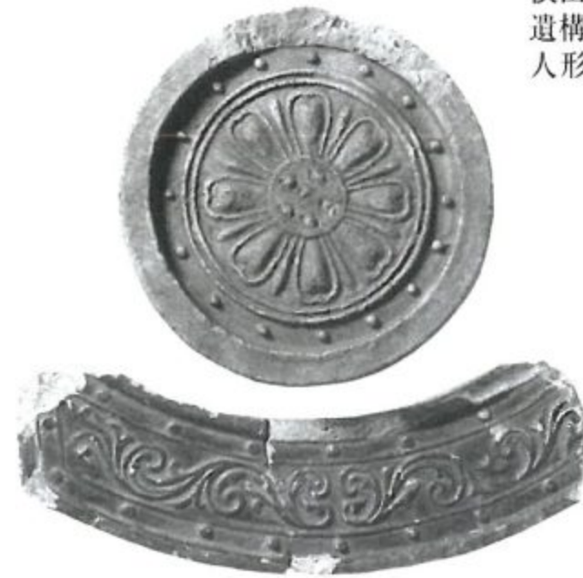
平安宮の屋根を美しく飾る瓦 重要文化財 平安宮豊楽殿跡出土品 緑釉軒瓦(京都市)