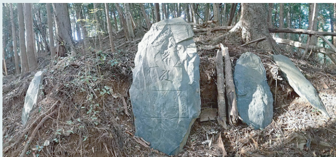
石巻市雄勝町呉坪板碑群