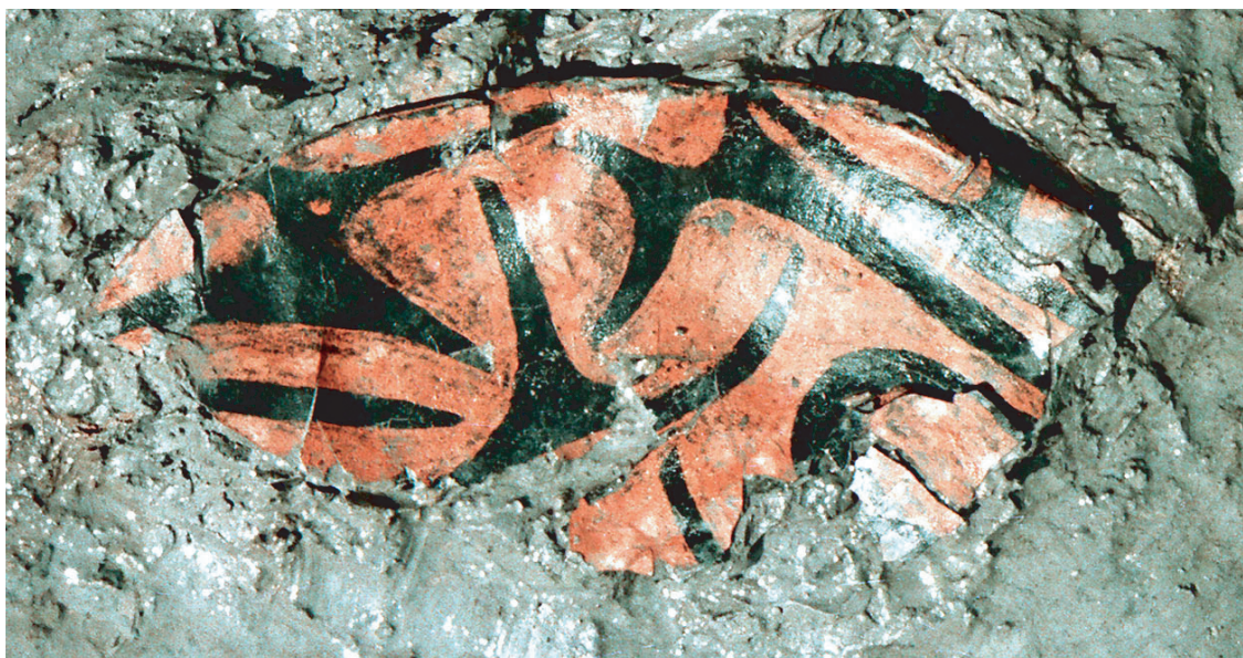
栗原市山王団遺跡藍胎漆器