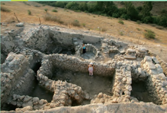
テル・レヘシュ (イスラエル)