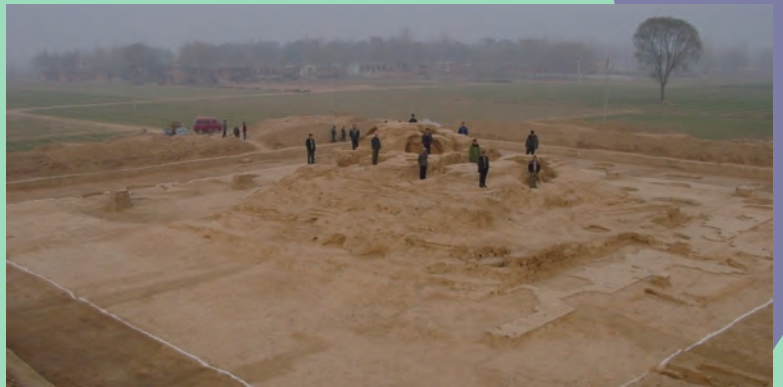
北齊鄴城の趙彭城廃寺木塔基壇 (中国)