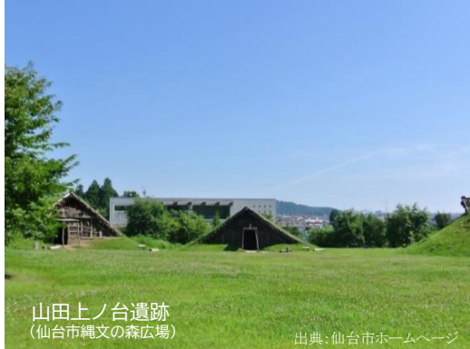
山田上ノ台遺跡 (仙台市縄文の森広場)