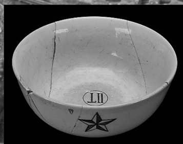
軍隊用に作られた硬質陶器

2 カ月にわたる展示期間中、江戸時代の出土品を中心に調査室が選りすぐった約 170 点を一堂に展示いたします。また、講演会やギャラリートークも企画いたしました。この機会にぜひ貴重な品々をご覧ください、いにしえに思いを馳せてみませんか。みなさまのご来場をお待ちしております。