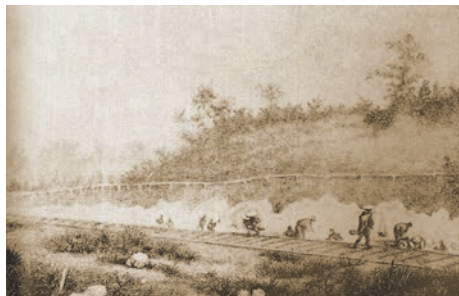
報告書『大森貝塚』の口絵スケッチ(1879)

1962年宮城県生まれ。宮城教育大学教育学部卒業。東北大学大学院医学系研究科修士課程修了。宮城県教育委員会を経て、2000年より奥松島縄文村歴史資料館勤務。大学1年の時から里浜貝塚の発掘に参加。「さとはま縄文の里史跡公園」整備に関わる。主な業績に『里浜貝塚総括報告書』（2025）