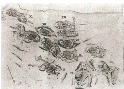
里浜貝塚人骨の出土状況スケッチ(1919)