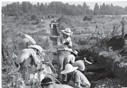
南貝塚の大発掘・長いトレンチと地形(1964)