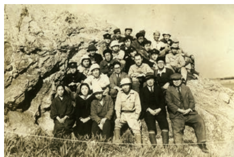
国営発掘調査参加者集合写真(1951)